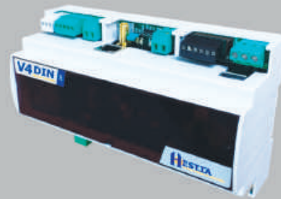
V4DIN-IP Starter Réf. 720128