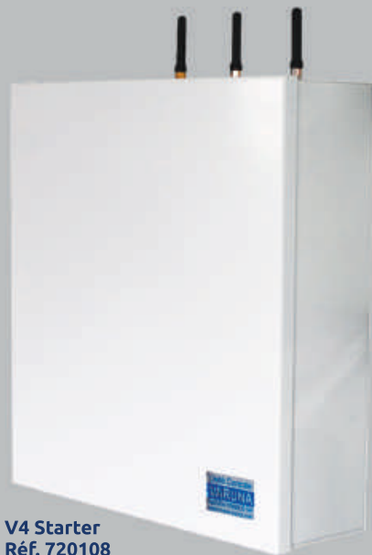
V4 Starter Réf. 720108