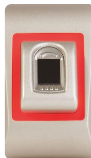
LED rouge Empreinte refusée