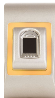
LED orange Mode veille