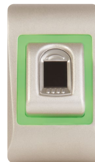
LED verte Empreinte acceptée